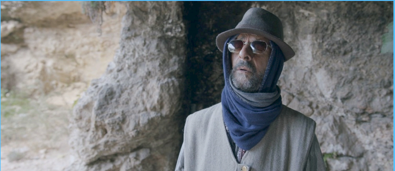
מתוך 'להתגרף עם אלוהים'