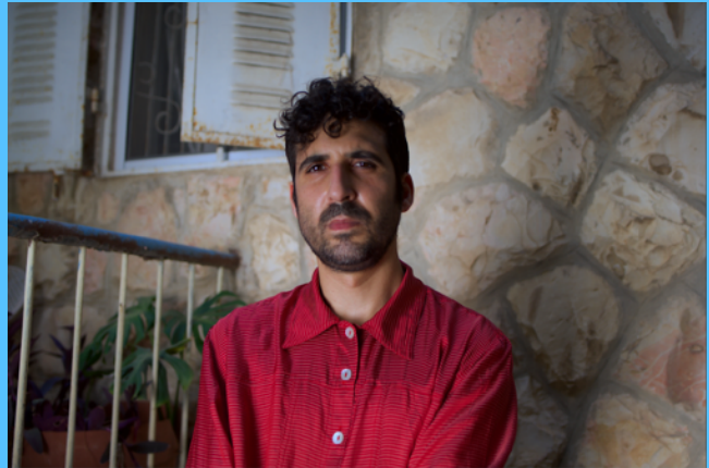
AMIT HAI COHEN

הוא מלחין יצירות תזמורתיות ומוזיקה למחול וקולנוע ויצר מספר סרטים ביניהם 'עוצרים את הפינוי' והדוקו המוזיקאלי 'יא לחמאמה' שהוקרן לראשונה בפסטיבל אסווירה. יחד עם שותפתו לחיים וליצירה, הזמרת והאמנית נטע אלקיים, יצר פרויקטים מוזיקליים רבים כמו "אביאדי" ו"ארנאס" אותם הוא ניהל מוזיקלית ושיתף פעולה עם מיטב האומנים בסצינה הצפון אפריקאית בארץ ובעולם. הזוג מככב כעת בסרטו של הבמאי המרוקאי קמאל האשקר "בעניין אני רואה את ארצו" (2019)