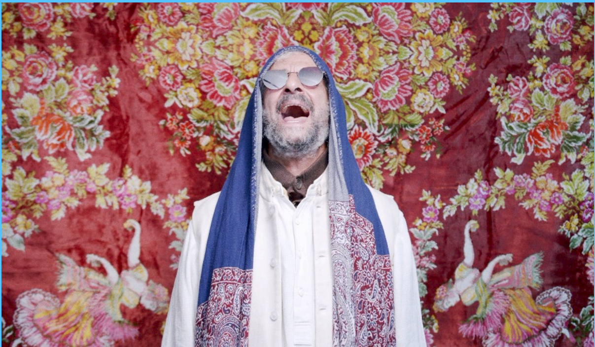
פריים מתוך 'להתאגרף עם אלוהים'

דוקו מוזיקאלי חדש מאת המוזיקאי והקולנוען עמית חי כהן בכיכובו של JOJO